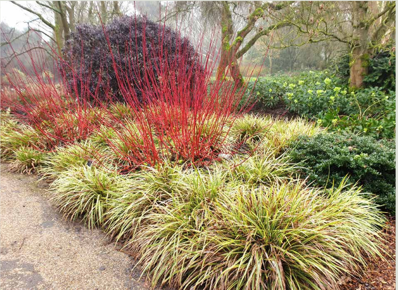
Rødgrenet kornel med bund af broget star.

fordel kunne skæres tilbage, for at de ikke breder sig uhensigtsmæssigt, men også for at opnå en frisk grenfarve hver vinter.