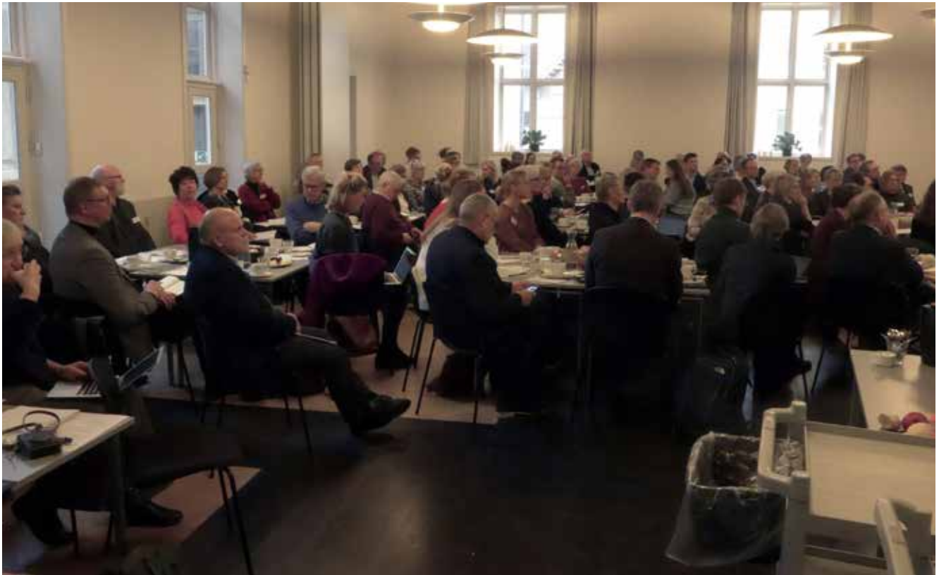
Det ypperste af det folkekirkelige system var stort set samlet til denne konference i Aarhus Domkirkes Sognegård, hvor der var fokus på folkekirken og dens kirkegårde, og den service der tilbydes i forbindelse med danskernes død og begravelse.