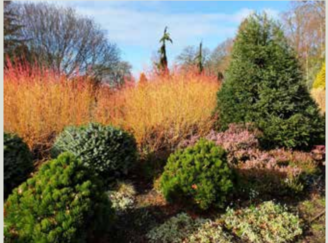
Der er gået ild den orangegrenede kornel.