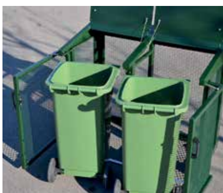
affaldssortering med bl.a. BIKAB