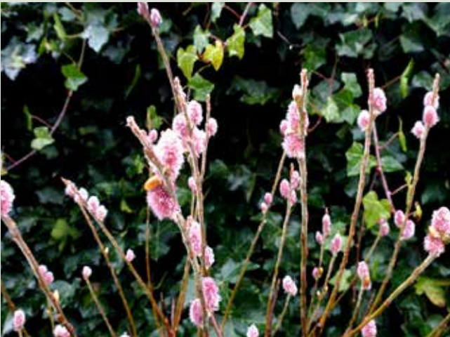
Salix gracilistyla 'Mount Aso' med gæslinger.