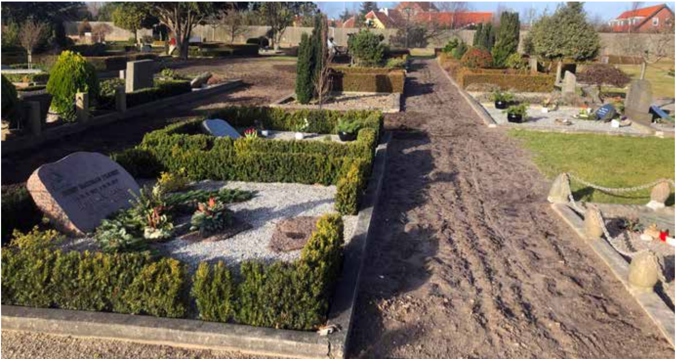
Grus gange er i etaper ved at blive omlagt til græs.