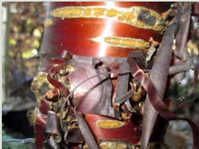
Prunus serrula bliver man aldrig træt af at kigge på.