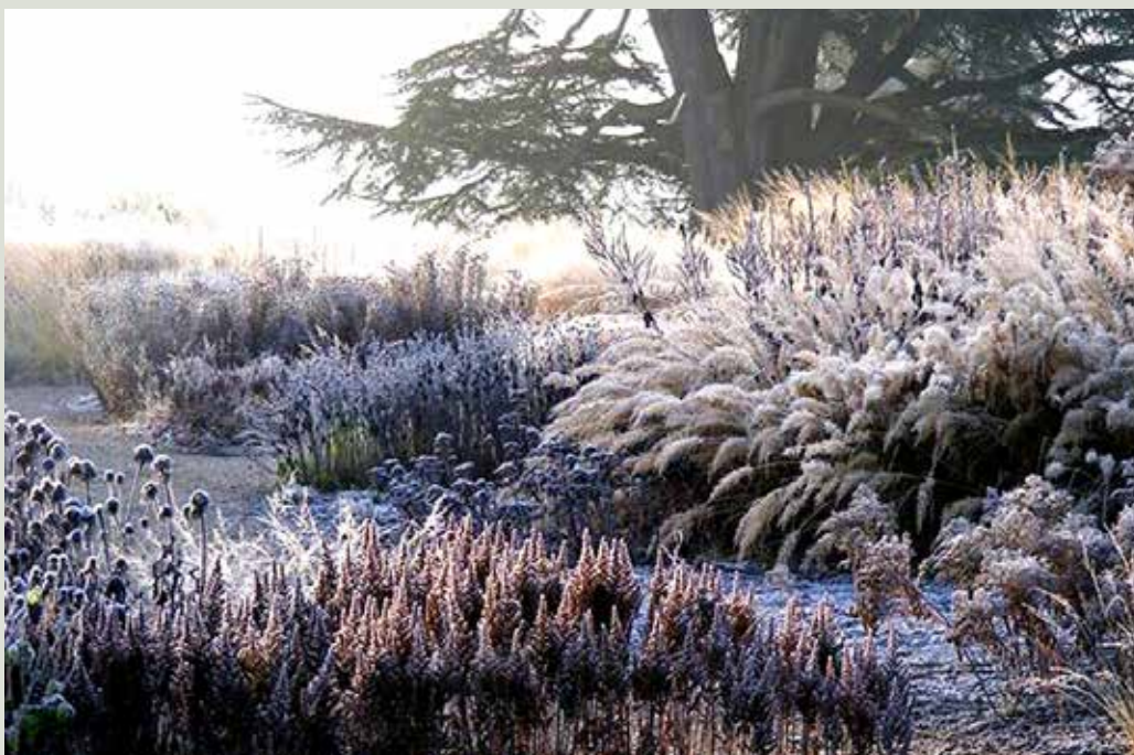
Astilbe ved vintertide.

Dykker vi ned i gruppen af vinterblomstrende planter møder man duftende troldnød ( Hamamelis x indermedia ) hvoraf der findes flere sorter fra gul, orange og rød, køjserbusk ( Viburnum x bodnantense ), duftende peberbuske ( Daphne bholua 'Jacqueline Postill') og ( Daphne odora 'Aureomarginata'), duftende kødbær ( Sarcococca hookeriana 'Winter Gem'), hasselbror ( Corylopsis spicata ), papirbusk ( Edgeworthia chrysantha )