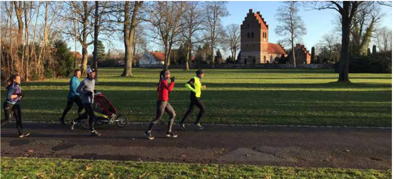
En af fremtidsvisionerne er at etablere en udendørs ceremoniplads, hvor man bl.a. kan blive viet, med en middelalderkirke som baggrundskulisse.