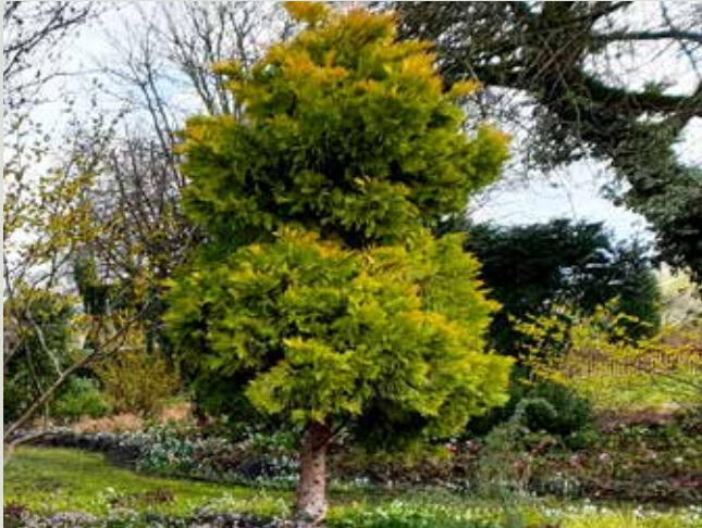
Calocedrus decurrens 'Berimma Gold' lyser op.