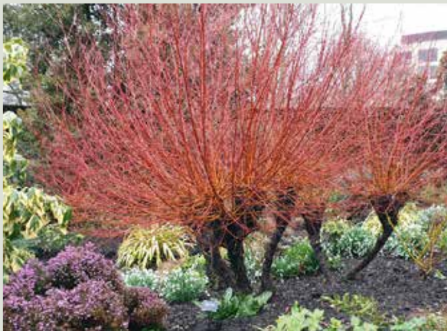
Salix alba 'Yelverton'.