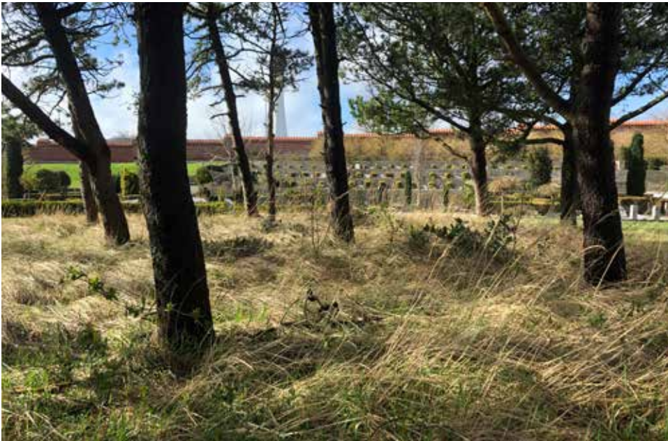
Den nordlige ende af Skagen Assistenskirkegård er utrolig smuk med sit naturnære udtryk.

sik i deres gård om sommeren. Det har affødt nogle artikler i lokalavisen med forargede borgere, der føler sig krænket på kirkegårdens vegne. Men som altid når nogen føler sig krænket, så er det ikke på vegne af dem selv. På kirkegården har vi nemlig ikke noget problem. Sjældent har musikken kunnet høres i kapellet, men ikke mere end at handlingen har kunnet fortsætte. Det bevidner bare at livet fortsætter, at vi nok skal komme igennem sorgen. Nu har jeg boet 7 år i København og jeg tror mange kirker, kapeller og kirkegårde oplever langt mere hverdags-støj og musik end Skagen Kirkegårde oplever i turistsæsonen.