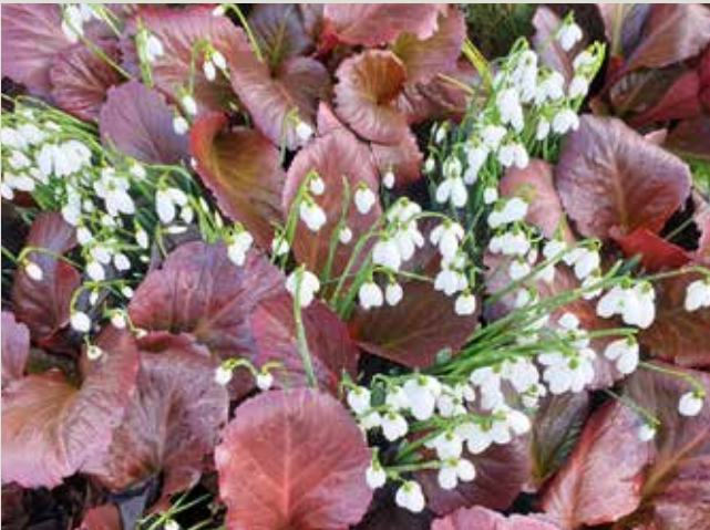
Vinterfarvede Bergenia kombineret med vintergækker.