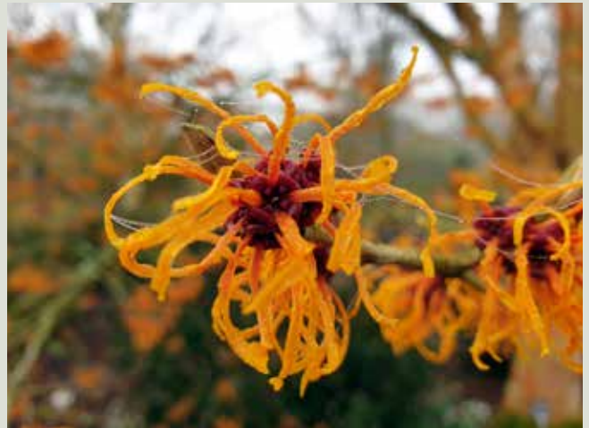
Duftende troldnød kan blomstre fra januar til april.