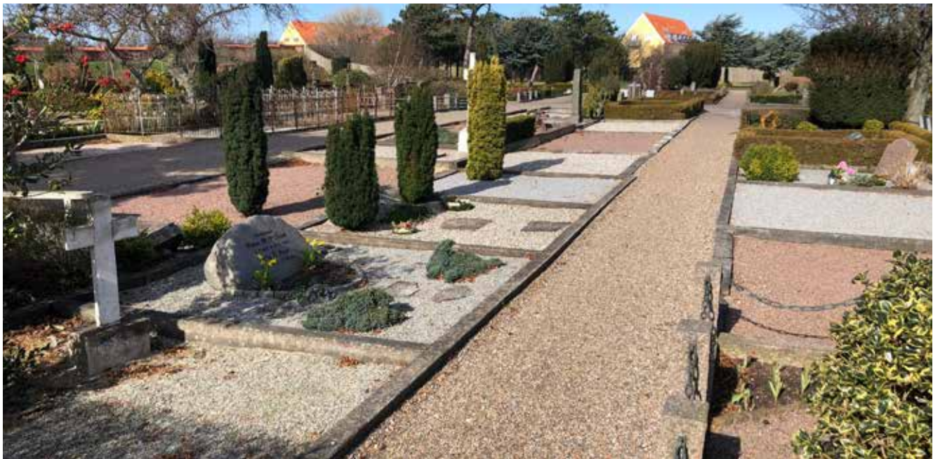
Afviklingen af kistegravsteder har skabt tomme og åbne plamager, som fremstår grå og triste.

danske kirkegårde er i deres udtryk meget ens med små parceller, som pårørende lejer for en årrække til deres døde. Der er undtagelser, hvor udtrykket er anderledes, men de er som regel meget unge, mindre end 50 år gamle.